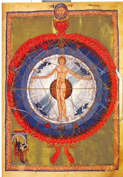
Hildegard van Bingen, de kosmosmens